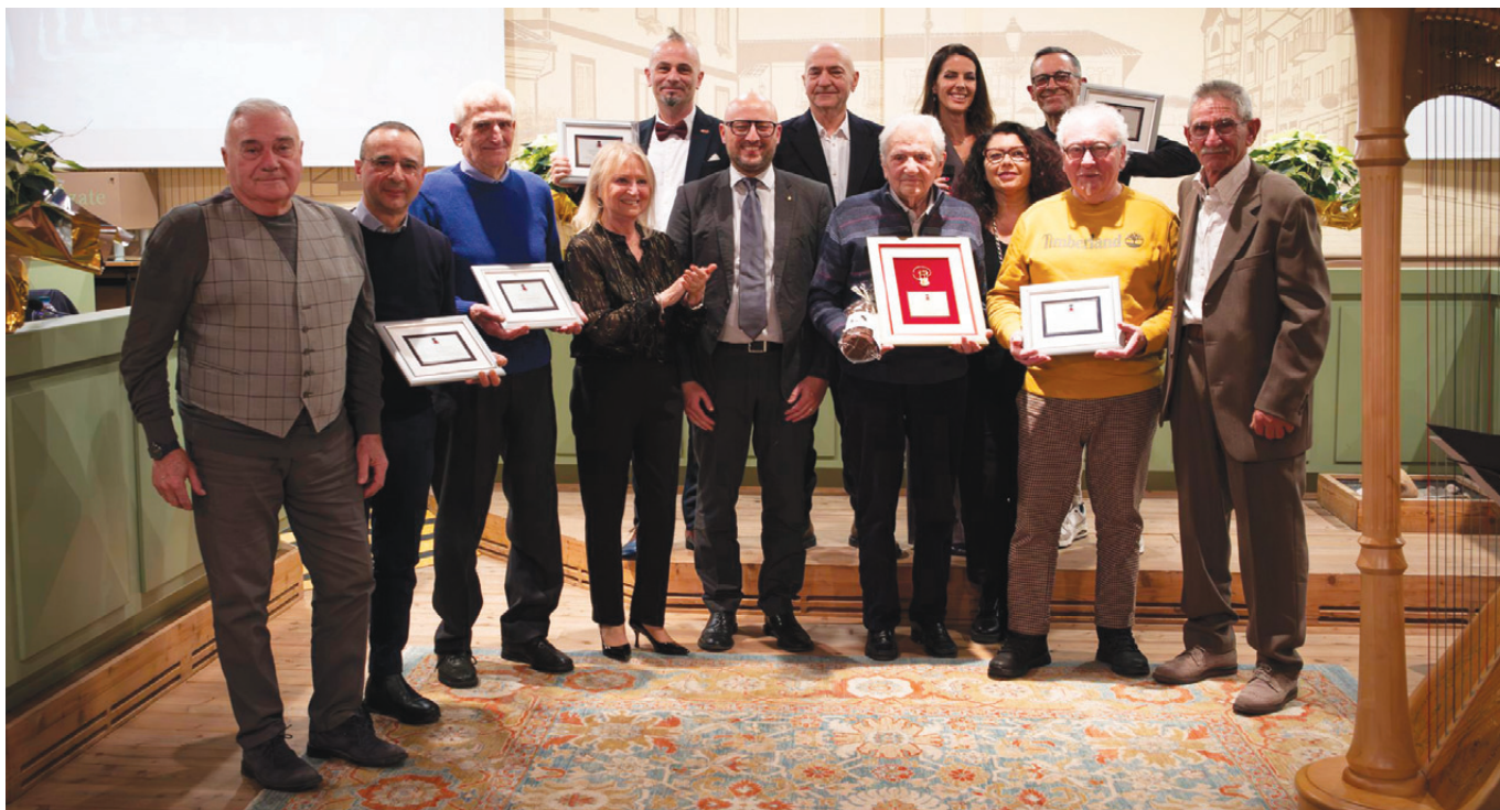
Tutti i premiati

Il grazie di Lazzate ai cittadini che continuano a farla grande